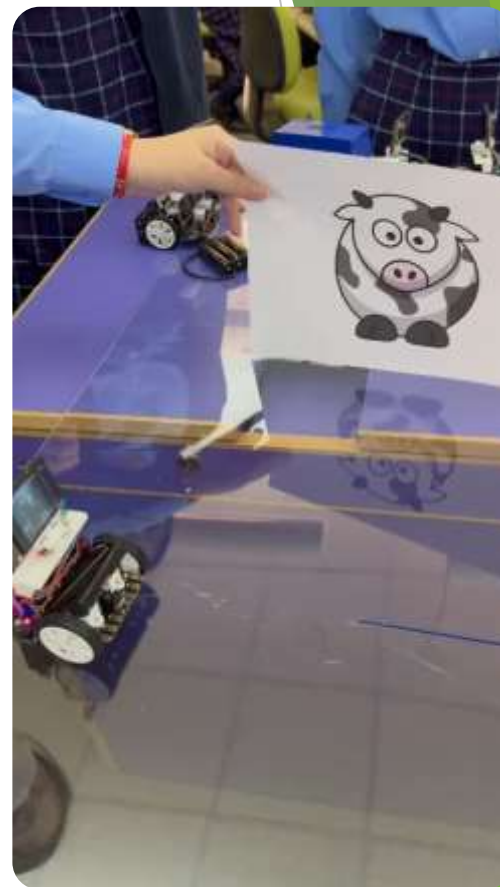
人臉識別功能 [片段以不同動物圖案展示]